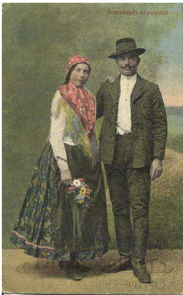
Szarvaskői pár ünnepi viseletben

Virágvasárnap jellegzetes szokás szerint egy szalmabábut többnyire menyecskeruhába öltöztettek. A kisze vagy más néven banya a tél, a böjt, a betegség megszemélyesítője, amelyet a lányok énekelve végigvittek a falun, majd pedig vízbe hajították vagy elégették. A kiszehajtás után sok helyen a villőzés következett. A lányok villónak nevezett faágakkal járták a házakat, ezeket a faágakat felszalagozták, olykor kifűjt tojásokkal díszítették. A kisze kivitele a tél kivitelét, a villő behozatala pedig a tavasz behozatalát jelentette.