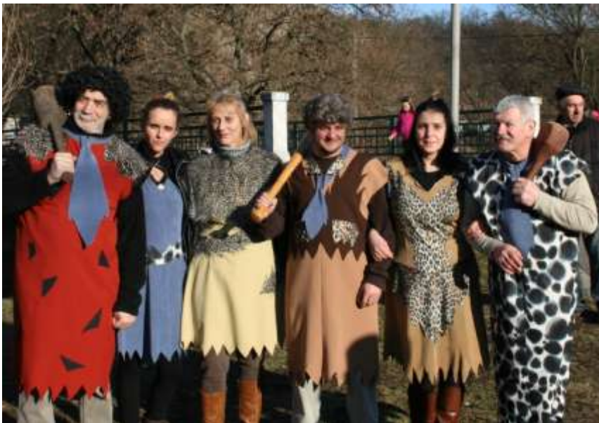
Nagy volt az izgalom a Polgármesteri Hivatalban, erre a napra a kőkorszaki Flinston család vette át az irányítást

A közönség nagy tetszéssel fogadta az ötletes jelmezekbe bújt gyerekeket és felnőtteket. Elismerésüket a számos kiváló álca között leginkább a Cicalány, a Kis Rendőr és a verseny első helyezettjeként, a fellépők legifjabb tagja, a Nagy Pöttyös Labda nyerte el. Különdíjat kapott a Flinston család, akik finom feketeerdő torta nyereményükkel mindjárt meg is vendégelték a délután valamennyi résztvevőjét.