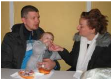
A legeslegapróbbak is bekukkantottak a buliba, jövőre már álöltözékben várjuk őket.