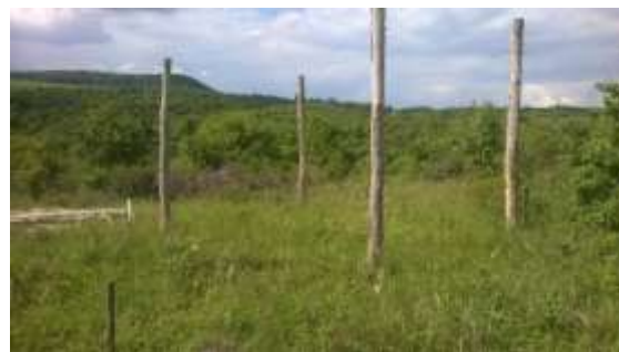
A JURTA 2001 területe

Tekintettel arra, hogy a földhasználati szerződés 2. sz. mellékletében megfogalmazott cselekvési ütemtervben, mely 2006 - 2010 közötti időszakra szolt, nem valósult meg pl. a 2.1. pontban meghatározott építkezés, mely a szerződés 7. pontjában meghatározott építmények felépítésére vonatkozott, a képviselő-testület a földhasználati szerződés azonnali hatályú felmondásáról döntött.